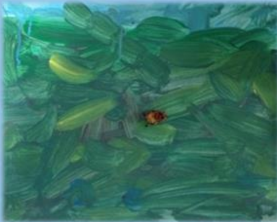
Naturens betydelse för hälsa