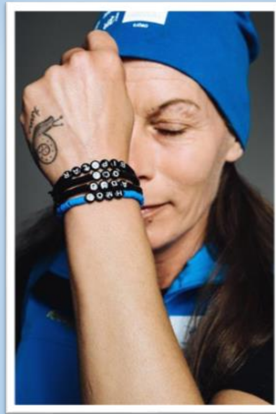
Deltagare HMOU Peer support